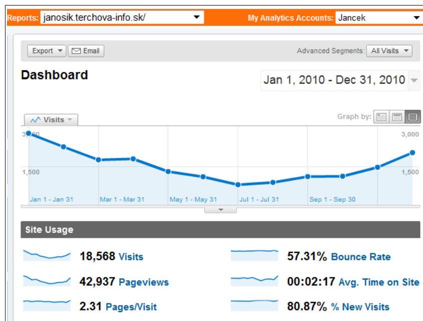
Obrázok: Štatistiky návštevnosti webu Jánošík vo filme (zdroj: Google Analytics)

Táto webová stránka ( http://janosik.terchova-info.sk/ ) prináša informácie o všetkých filmoch o Jánošíkovi, o ich histórii, hercoch, natáčaní a o všetkom, čo s tým súvisí. V roku 2010 túto stránku navštívilo vyše 18 tisíc ľudí.