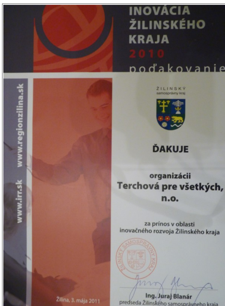
Obrázok: Podakovanie Žilinského samosprávneho kraja neziskovej organizácii Terchová pre všetkých za prínos v oblasti inovačného rozvoja Žilinského kraja

Terchová @ pre všetkých nezisková organizácia